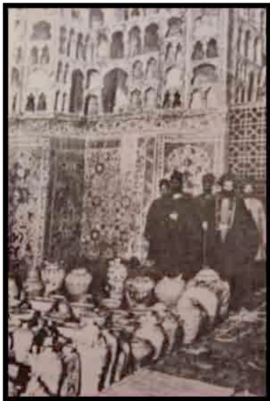
تصویر 4، داخل چینی‌خانه در سال 1897 میلادی (ویور، 1355، ص