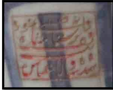
تصویر 5، حک «بندۀشاهولایتعباس» بر روی ظروف چینی