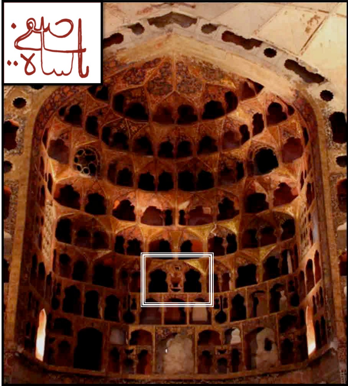
تصویر سه، کتیبه «پاشاه‌صفی» در کنه‌پوش جبهه غربی