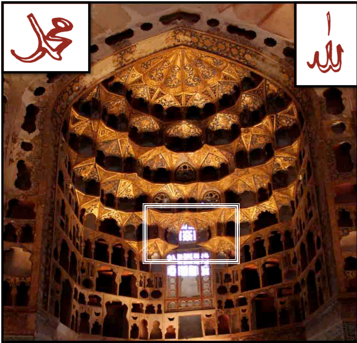
تصویر یک، کتیبه «الله» و «محمد» در بالای کتیبه «یا علی»، کنهپوش جبهه شمالی